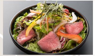
Mixed Green Salada with Roast Beef