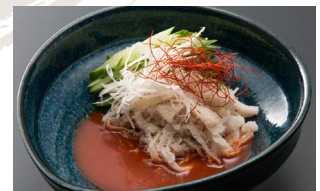
Beef White Omasum Sashimi