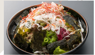
Scallion and Seaweed Salad with Special Dressing