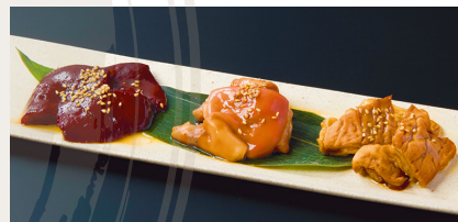
Today's 3 Kinds of Assorted