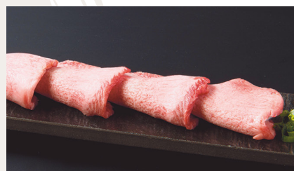
Wagyu Tongue With Salt

• Tongue with Salt and Green Onions / 上葱タン塩焼き tongue is from NewZealand or USA 1,850JPY