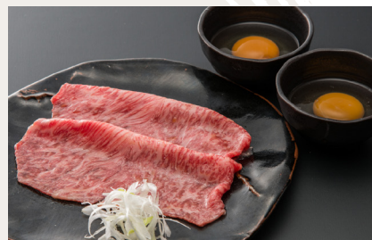
Grilled Sirloin Sukiyaki This picture shows 2 slice of sirloin