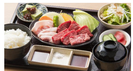
This picture is image of 'Lunch A'