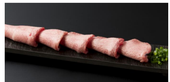
Wagyu Tongue With Salt

▪Tongue with Salt and Green Onions 1,850JPY tongue is from NewZealand or USA / 上葱タン塩焼き