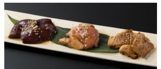
Today's 3 Kinds of Assorted