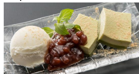
Matcha Milk Pudding