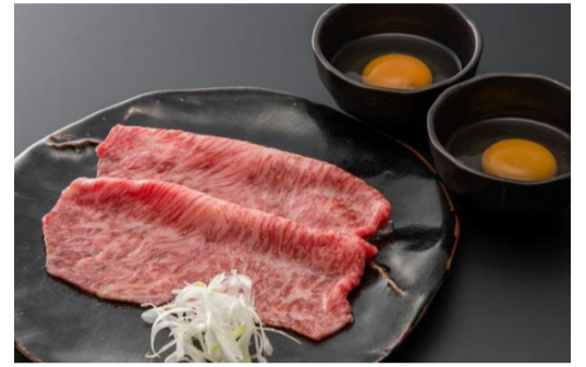
Grilled Sirloin Sukiyaki This picture shows 2 slice of sirloin