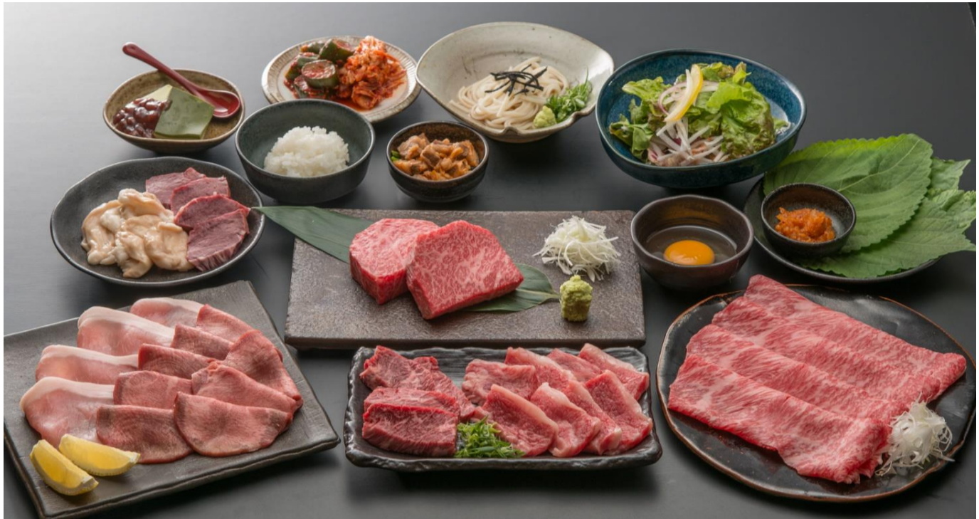
This Picture shows 'Deluxe Course' for 4 People.

*Course menus are up to stock availability