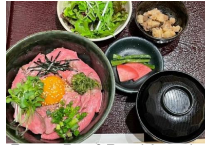
Roast Beef Bowl Lunch