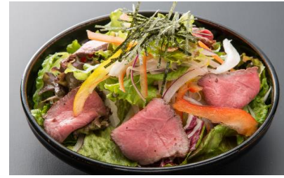
Mixed Green Salada with Roast Bee