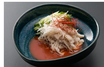
Beef White Omasum Sashimi