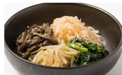
Assorted Homemade Namul