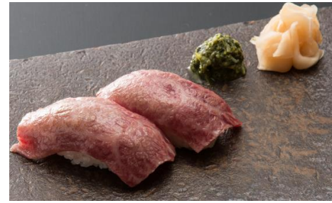
Premium Wagyu Sushi