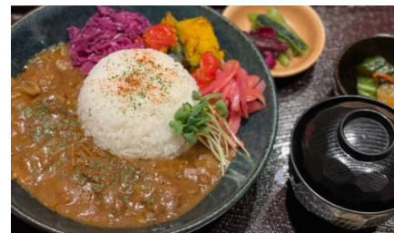
Curry and Rice with Beef Tendon