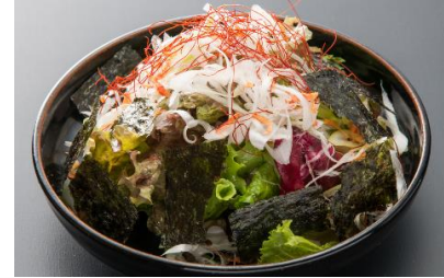
Scallion and Seaweed Salad with Special Dressing