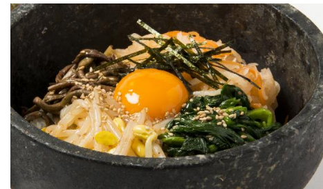
Stone Grilled Bibimbap